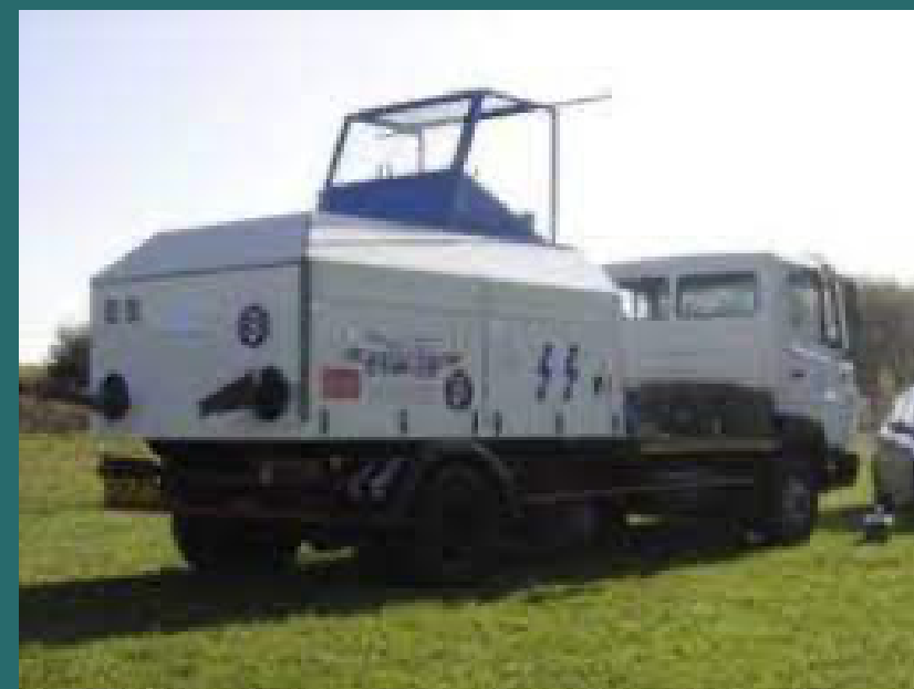
Treuil électrique de Chérence