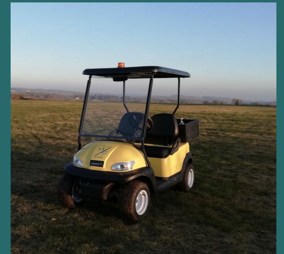
Golfette électrique de Chérence

En 2022, la majorité des véhicules de pistes sont électriques . Le remplacement des moteurs thermiques permet d'économiser 160 litres de carburant par an, par véhicule.