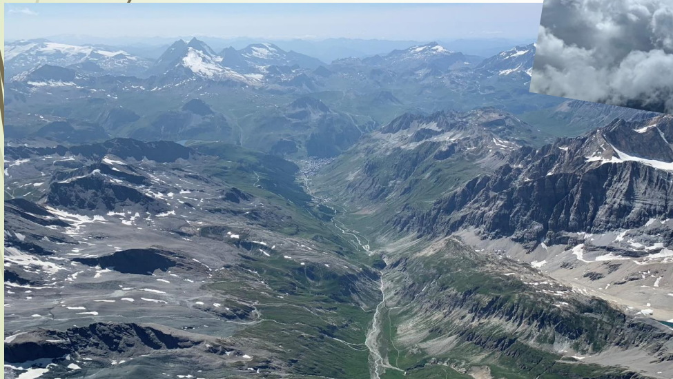
Val D'Isère vu depuis les sources de l'Isère, au 2° plan, la Grande Motte (Tignes) et la Grande Casse.