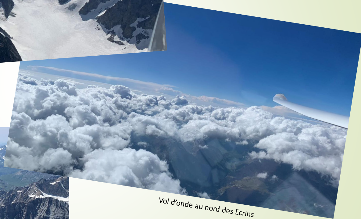
Vol d'onde au nord des Ecrins