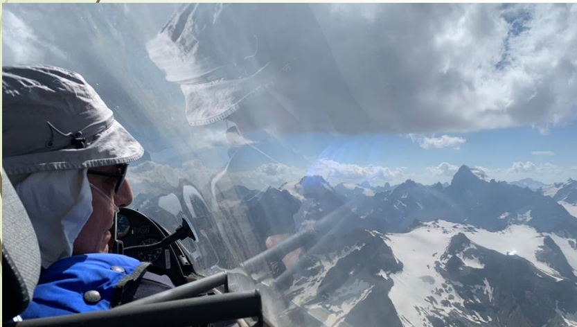
Passage de la Barre des Ecrins

Parmi les pilotes, des « vieux trapus » (grosse expérience montagne) et d'autres en apprentissage ou en vols découverte de la montagne, aux bons soins de 3 instructeurs/guide-découverte sur les 2 duos EP et 28.