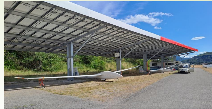
Les 2 Duo Discus sous les ombrières, en protection soleil, pluie et grêle.