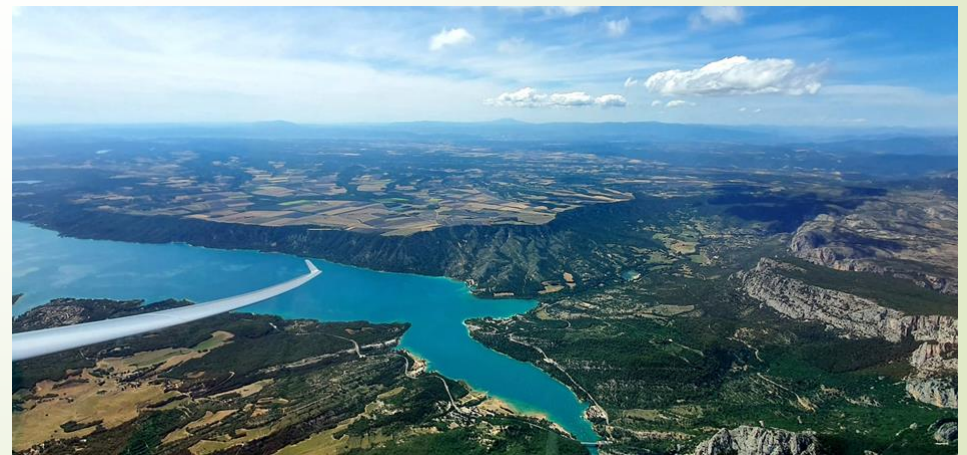
Lac de Sainte Croix sur le Verdon